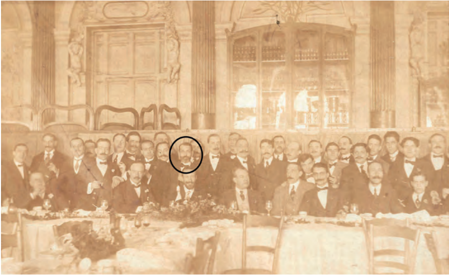
FIGURA 4. Fotografia d'un dinar de l'Orquestra Simfònica de Barcelona (1910-1925) presidit per Joan Lamote de Grignon.