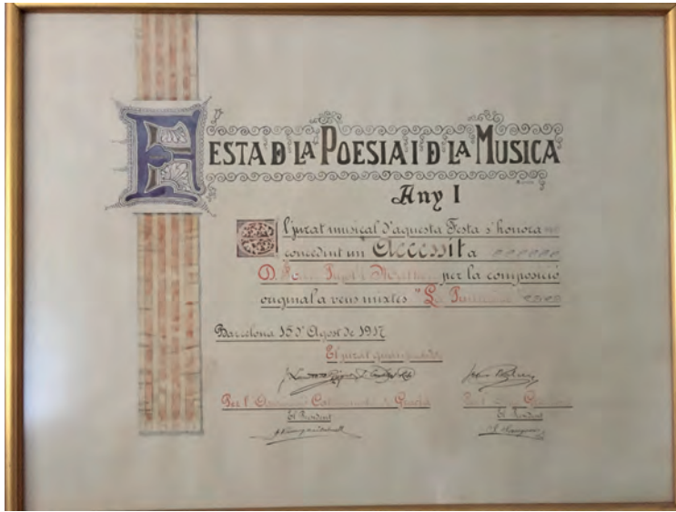
FIGURA 7. Diploma de l'accessit per La puntaire obtingut a la Festa de la Poesia i de la Música de l'any 1917.