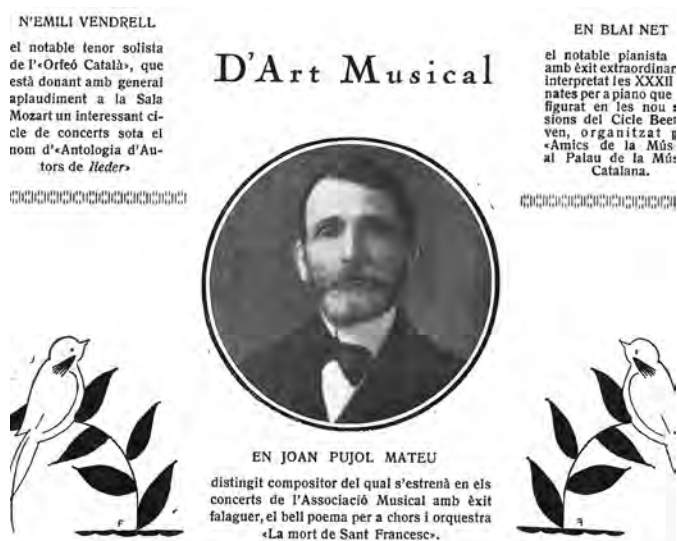
FIGURA 8. Ressenya a la revista mensual D'ací i d'allà del mes de maig de 1921 sobre l'estrena de Mort de Sant Francesc .

L'obra Mort de Sant Francesc va ser estrenada anys més tard, el diumenge 24 d'abril del 1921, 43 en un concert ofert al Teatre Eldorado per l'Orquestra Simfònica de Barcelona i l'Orfeó Gracienc. Joan Lamote de Grignon va ser-ne el director i a l'estrena el mateix Joan Pujol estava tocant a l'orquestra. 44 El concert va ser l'objecte d'una ressenya a la revista D'ací i d'allà 45 (figura 8) i d'una crítica a La Veu de Catalunya . 46